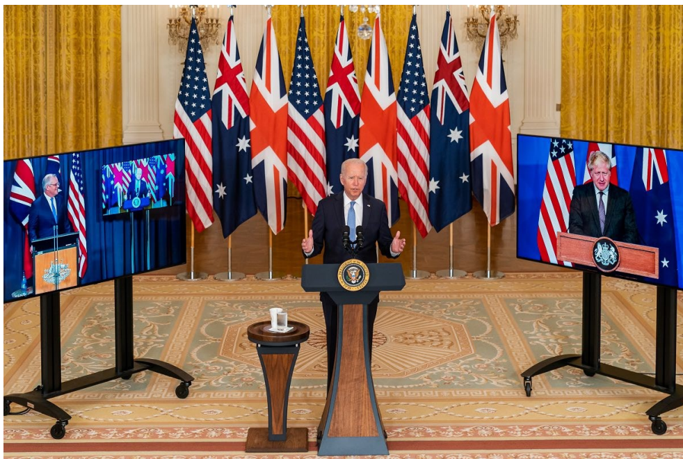
2021년 9월 15일 호주, 영국과 함께 3국 언론 성명을 발표하는 조 바이든 미국 대통령

이 기간 동안 캔버라의 가장 큰 두 가지 결정은 2018년 8월 호주 5G 네트워크 입찰에서 중국 기업 화웨이를 비롯한 '고위험 공급업체'를 배제하기로 한 결정과 2021년 9월 호주가 미국, 영국과의 새로운 3국 안보 및 기술 파트너십인 AUKUS의 일환으로 원자력 추진 잠수함을 획득하겠다고 발표한 것입니다.